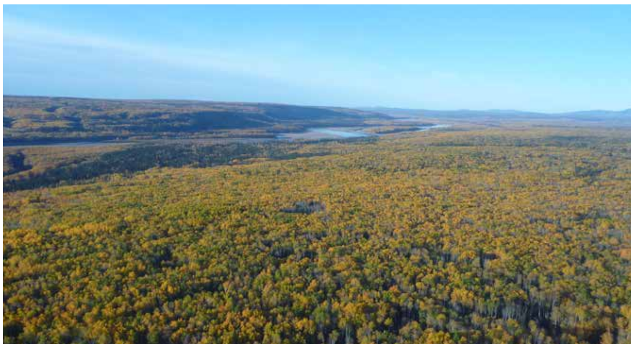
Région de Fort Liard, Territoires du Nord-Ouest