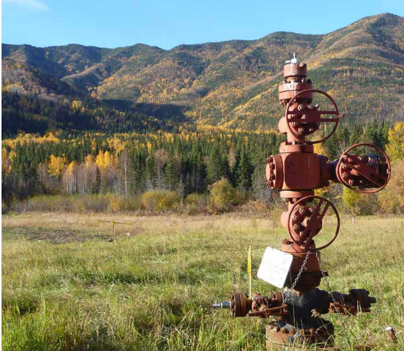
Tête de puits dans la région de Fort Liard, Territoires du Nord-Ouest (BOROPG)

notamment le rôle des personnes directement touchées. Ce document a été créé pour préciser le processus à l'intention de toutes les parties intéressées, en particulier celles qui n'œuvrent pas dans l'industrie du pétrole et du gaz, comme les gouvernements autochtones et les membres des collectivités situées à proximité des zones de découverte importante. Étant donné que la majorité des activités pétrolières et gazières dans le territoire de compétence du BOROPG sont menées dans le Sahtu, le Bureau a également rencontré les parties intéressées de cette région, pour leur faire part du document de questions-réponses et discuter du processus de déclaration de découverte importante en personne.