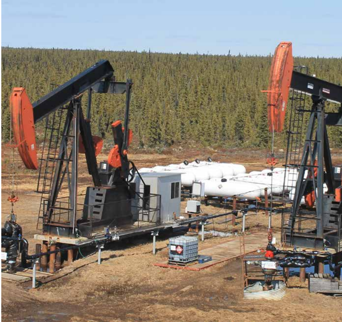
Cameron Hills, Territoires du Nord-Ouest (BOROPG)