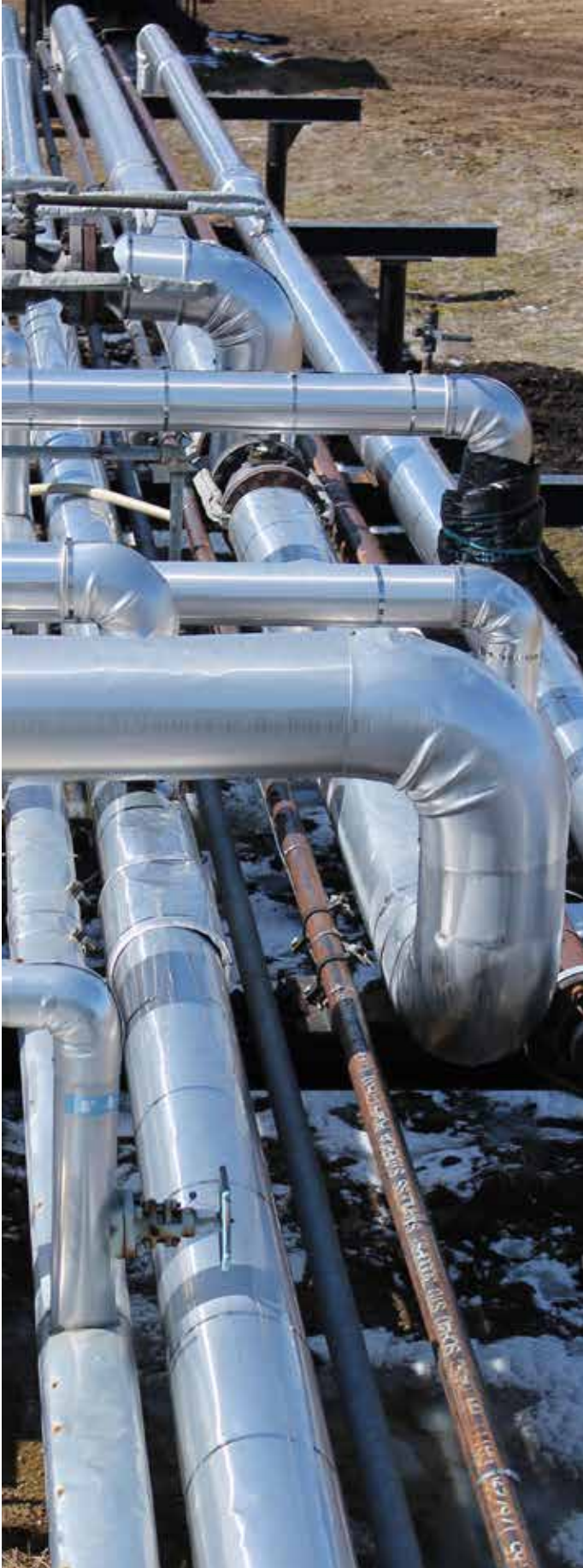
Cameron Hills, Territoires du Nord-Ouest ( BOROPG )

Calgary. Il a donné des présentations sur le rôle de l'organisme de réglementation et sur la réglementation des activités pétrolières et gazières aux TNO à un public varié lors de différents événements, notamment :