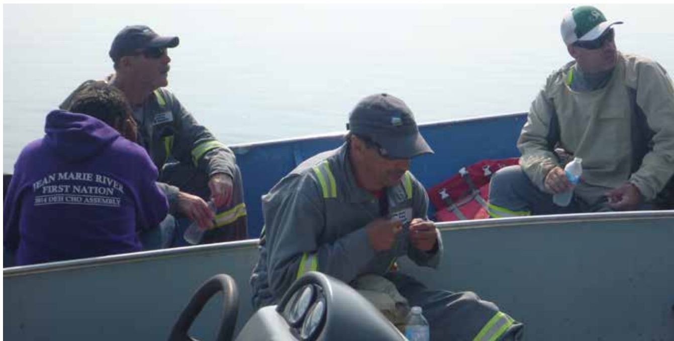
Équipe d'inspection à Jean Marie River (BOROPG)

En 2014-2015, le BOROPG a reçu les rapports d'inspection d'exploitants chargés du contrôle régulier des puits dont l'exploitation a été suspendue. D'après la législation, les exploitants doivent veiller au bon état des puits dont l'exploitation est suspendue et s'assurer qu'il n'y a pas de fuite; pour ce faire, des inspections et un contrôle réguliers sont nécessaires. Le personnel du BOROPG passe ces rapports en revue et effectue le suivi auprès des exploitants, afin de résoudre tout problème éventuel, ce qui pourrait nécessiter de demander au BOROPG l'autorisation de procéder à des travaux de remise en état, de suspendre à nouveau ou d'abandonner l'exploitation du puits concerné.